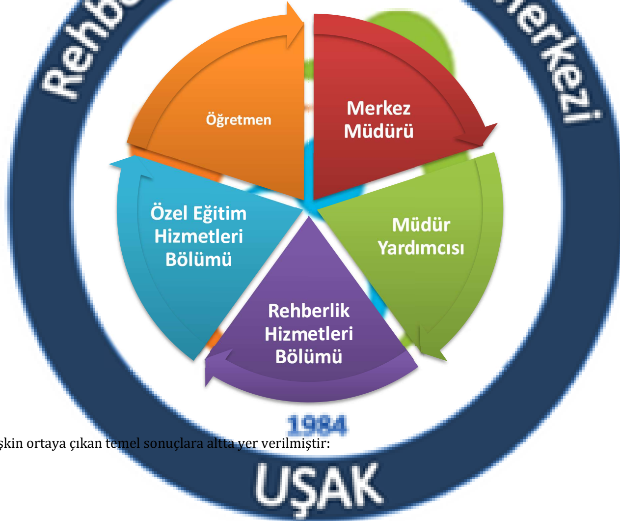
ŞEKİL:1 PAYDAŞ ANALİZİ

Paydaş anketlerine ilişkin ortaya çıkan temel sonuçlara altta yer verilmiştir: